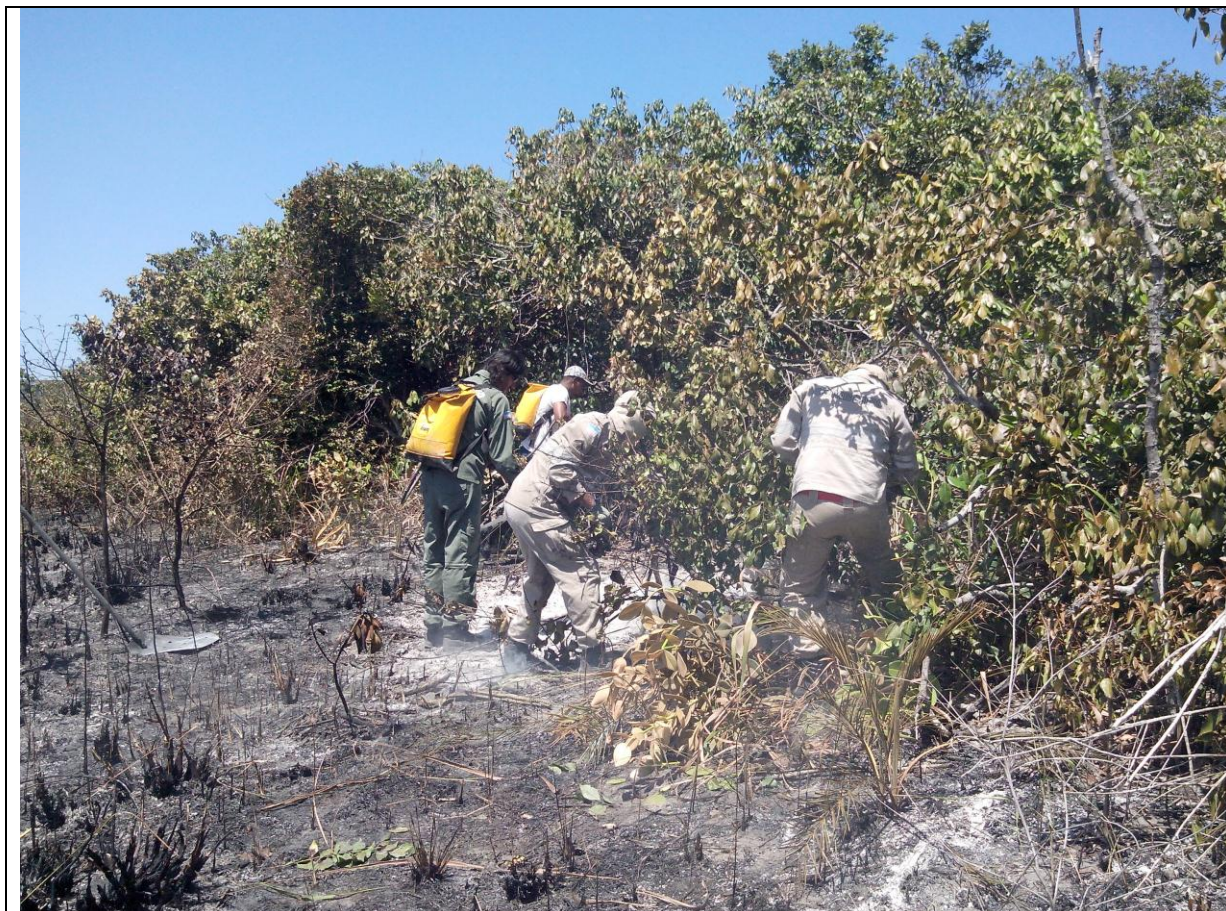
Legenda: Primeiro combate realizado por funcionários do PEPCV e Corpo de Bombeiros.