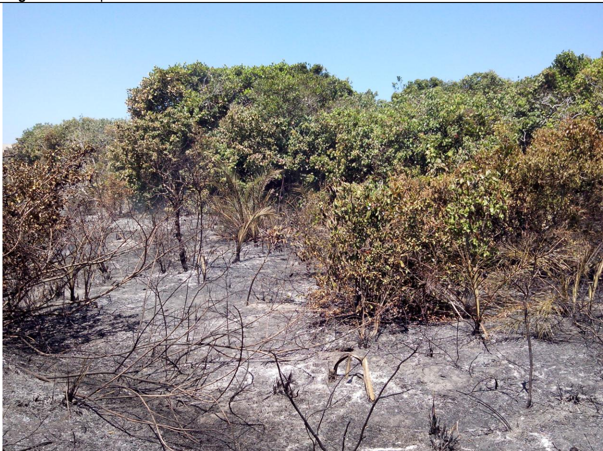
Legenda: Vegetação de Restinga atingida.