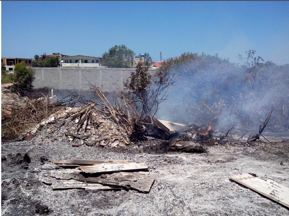
Legenda: Local provável onde se iniciou o incêndio.