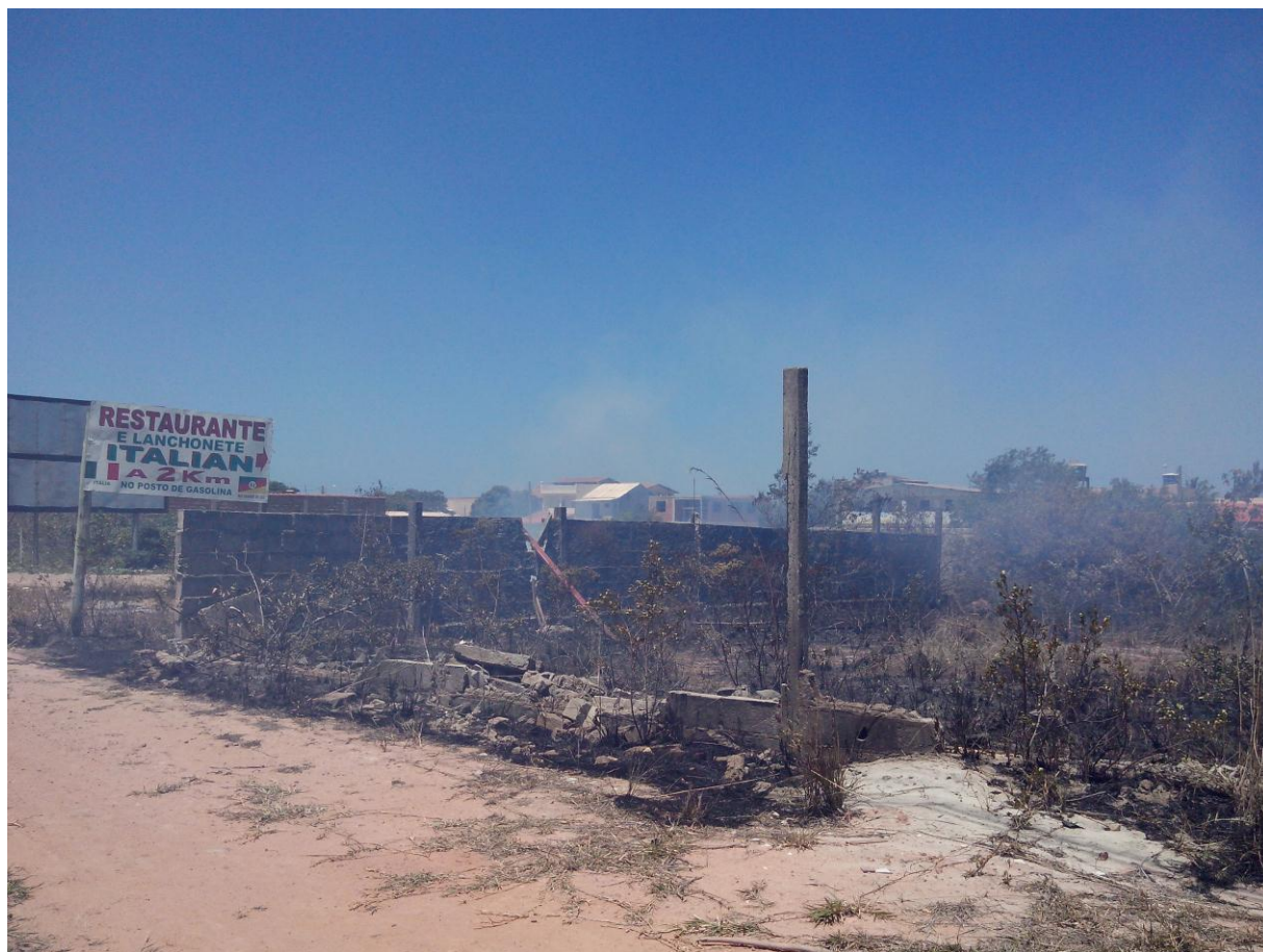
Legenda: Limite do Parque Estadual Paulo Cesar Vinha com o bairro Recanto da Sereia.