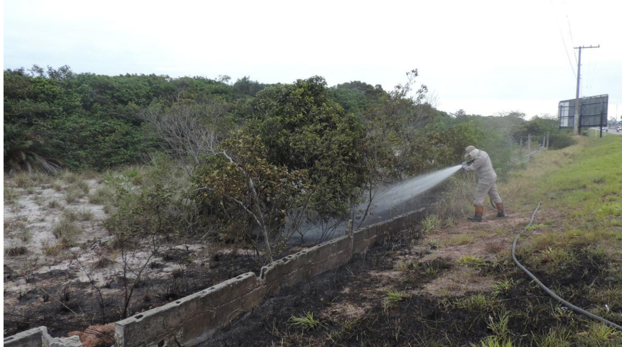
Legenda: Auxílio do Corpo de Bombeiros no segundo combate.