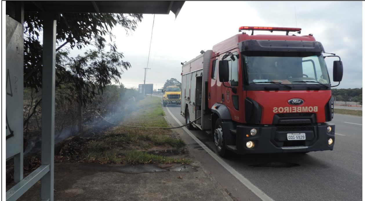
Legenda: Veículo ABT do Corpo de Bombeiros e Carro Pipa da Rodosol.